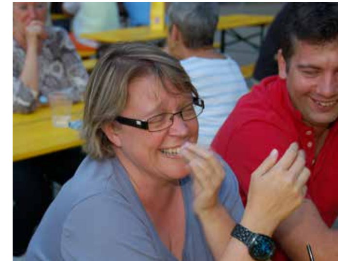
Trotz verregnetem Sommer, war die Sommerparty der SPÖ ein Erfolg!

Noch heuer wird der Gehsteig zwischen der Thumergasse und dem Ellinggraben hergestellt. Das noch fehlende Stück mit einer Länge von etwa 150 m kann nun endlich gebaut werden. Die Kosten sind relativ hoch, weil der Böschungsbereich mit einer Löffelsteinmauer gesichert werden muss. Aufgrund der Kosten wurde dieses Vorhaben immer wieder verschoben. Durch die Unterstützung des Landes im Bereich des Straßenbaus, können wir das Vorhaben umsetzen. Wir freuen uns über die Realisierung noch vor dem Winter, welche eine wesentliche Erhöhung des Sicherheitsniveaus für Fußgänger sicherstellt.