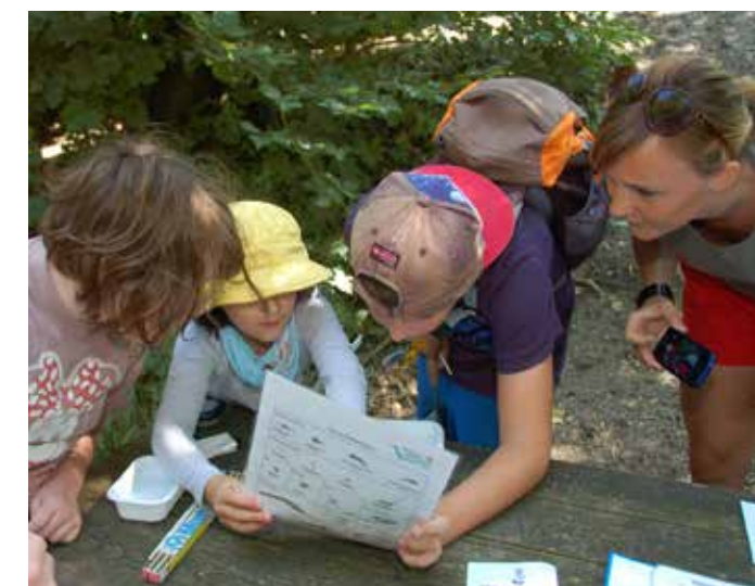
Ferienspiel Naturfreunde und Bücherei „Wasserlebensräume“