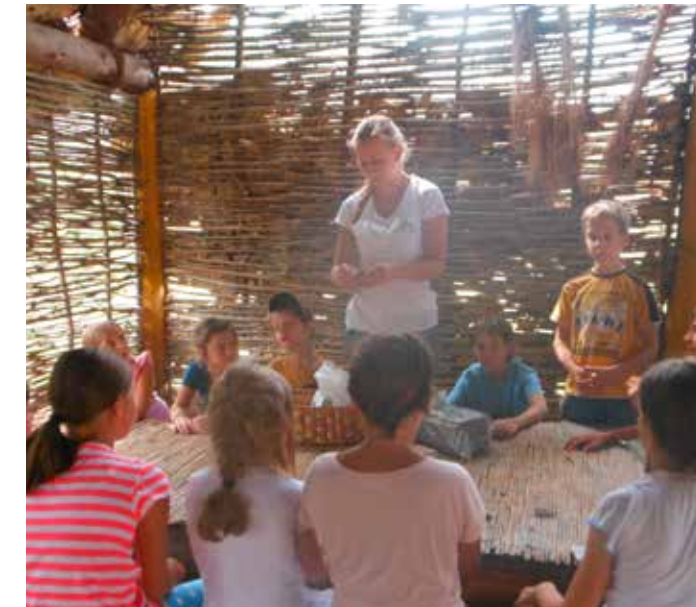
Ferienspiel ARBÖ: Lipizzaner & Steinzeitdorf